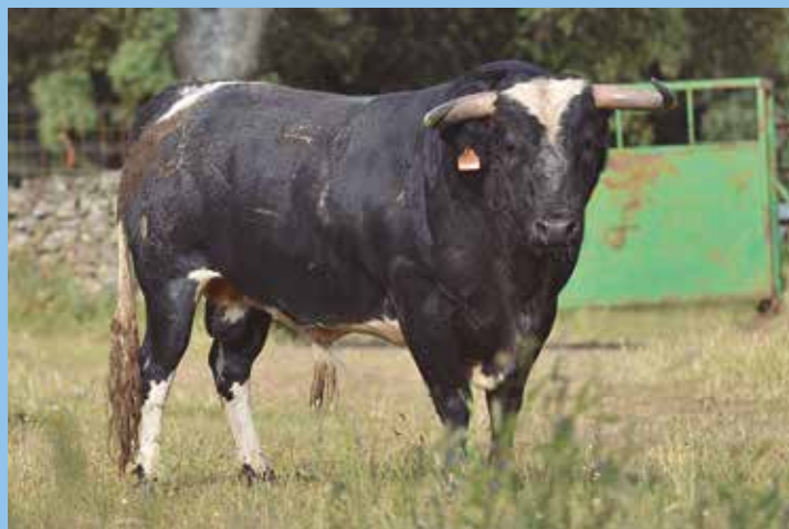
Burel con hechuras típicas del encaste Vega-Villar