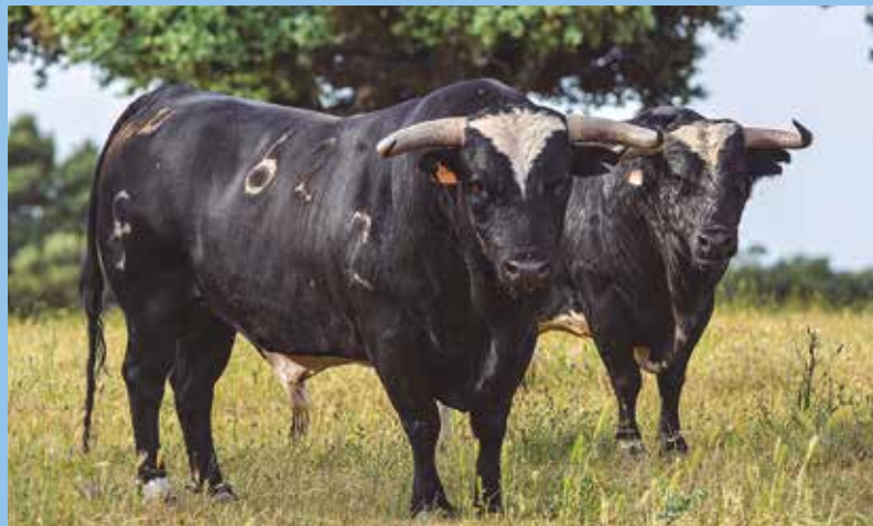
Dos bonitos ejemplares con una morfología muy característica