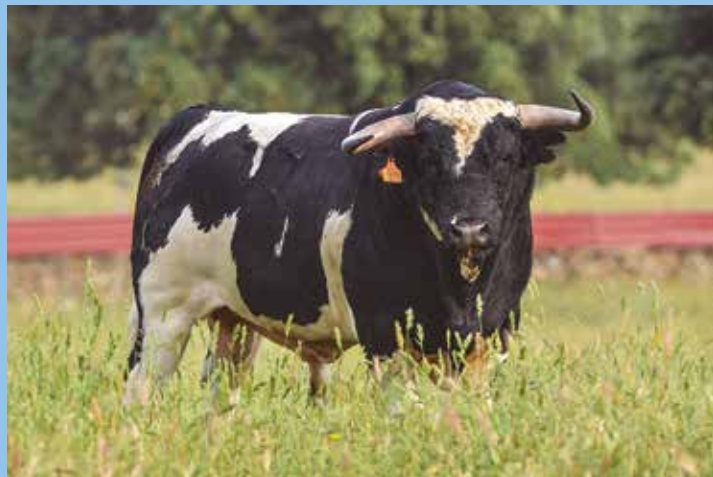
Un utero berrendo con hechuras típicas de la casa Barcial