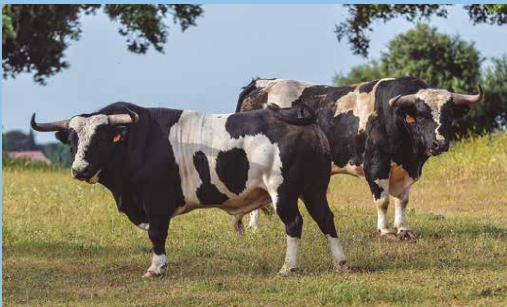
Dos berrendos en negro con mucha romana, hechuras preciosas y buena encornadura

Como es lógico, la ganadería ha evolucionado con el paso de los años. La implantación de la báscula y la exigencia de las plazas de primera categoría obligaron a incrementar algo el tamaño de las reses, siempre sin perder el fenotipo propio del encaste. En cuanto al comportamiento, Jesús reconoce que hoy el toro de Barcial es más bravo que antaño , destacando especialmente en la suerte de varas, donde