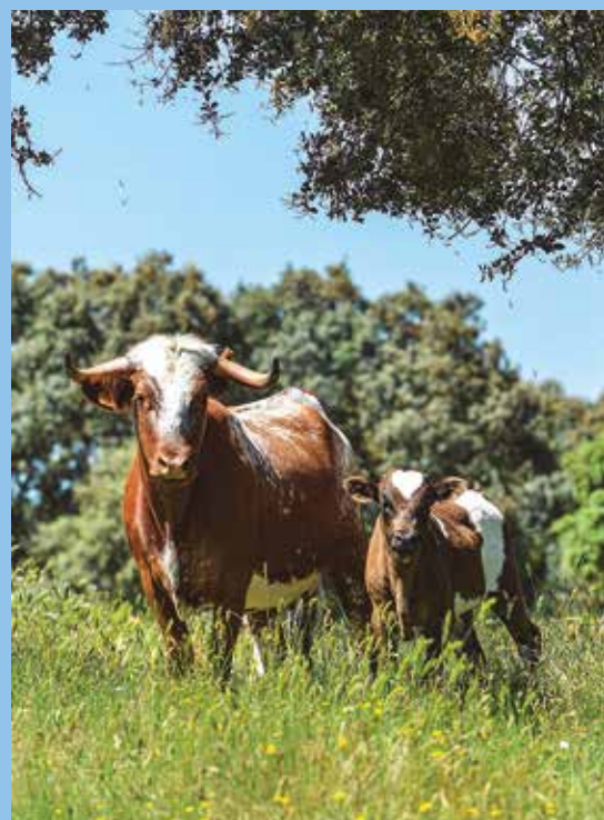
Se recupera el berrendo colorado

Con esta entrañable historia dimos por finalizada la visita, agradeciendo la amabilidad y facilidades ofrecidas por todo el equipo de Barcial , con el deseo de que la próxima temporada sus novilladas y reses para festejos populares sigan ofreciendo el espectáculo y la emoción que se espera de un hierro con tanta verdad y personalidad.