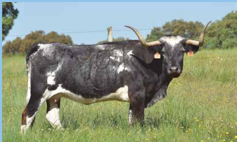
Una vaca de vientre con una más que respetable arboladura | FOTO: J. PORCAR