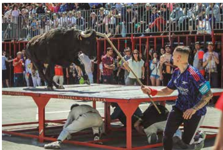
Corrupta de Benavent trabajó muy bien el tablado