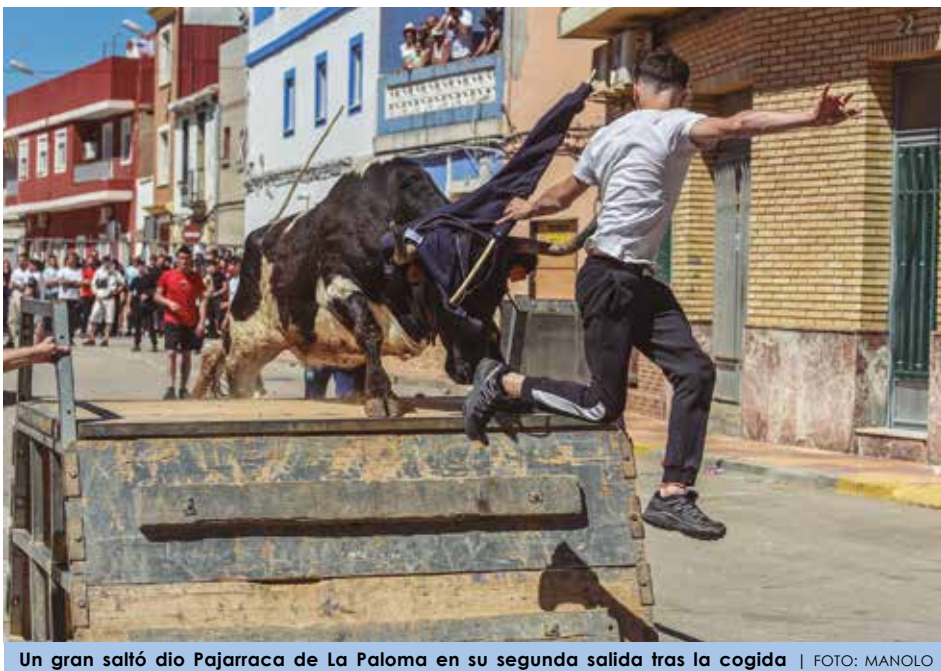
Un gran saltó dio Pajarraca de La Paloma en su segunda salida tras la cogida

El miércoles 15 actuaba el hierro alicantino de La Paloma . La mañana dejó un corro completo, lleno de matices y con vacas que, en líneas generales, cumplieron con creces. Abría plaza Carcelera , vieja conocida en Cullera, donde ya suma tres años consecutivos acudiendo. Conocedora del terreno, no tardó en meterse en faena, subiendo al tablado y rematando con maldad en los barrotes. Le seguía Corredora , que en un primer momento pareció reacia, pero que, tras ser rodada, se vino arriba, llegando a hacer hilo y generar momen-