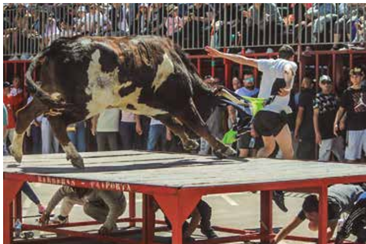
Subida en carrera de Pascu a Castañero de Benavent