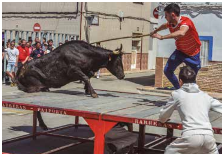
Pepito subiendo a Puñalera de La Paloma al tablado

damente, todo quedó en un susto. Tras ese momento fue encerrada para volver más tarde a salir. La vaca trabajó fuerte de salida, mostrando aún más determinación en sus acciones, con un gran salto a la tijera y una espectacular subida a la pirámide en carrera, así como al tablado, lo que le valió una fuerte ovación al ser encerrada. Florida mostró seriedad y nobleza en las rodas, dejando también subidas al tablado. En una arrancada se ensañó con un mozo que erró en su salida, calle cuesta arriba, afortunadamente sin consecuencias graves. Cerró la mañana Colegiala , que desarrolló la mayor parte de su actuación en la parte alta del recorrido.