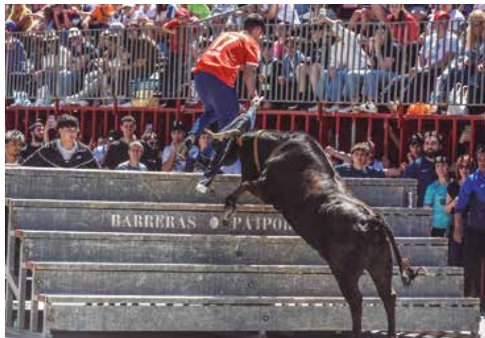
Corredora de La Paloma en una buena subida a la pirámide