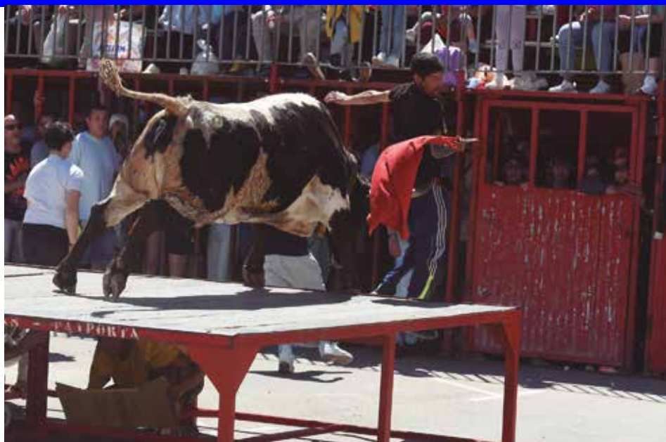
Gran bajada de Pajarraca alcanzando a este aficionado al que dio una paliza