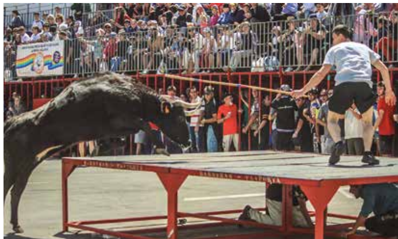
Corrupta de Hnos. Benavent en una de sus subidas