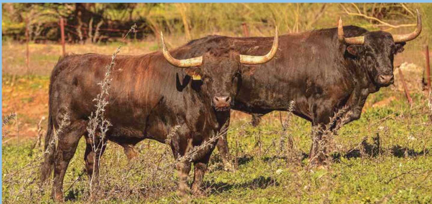
Dos bureles con respetable arboladura y un trapío importante en uno de los cercados de la finca La Valdivia en Osuna

Visitar la finca "La Valdivia", donde pasta la ganadería de D. Julio A. de la Puerta y Castro, es adentrarse en un lugar en el que el culto al toro y al caballo constituye la auténtica seña de identidad de una familia numerosísima cuyo eje vital gira en torno a estos bellos animales. Para quien escribe, pocos animales hay más hermosos que el toro bravo.