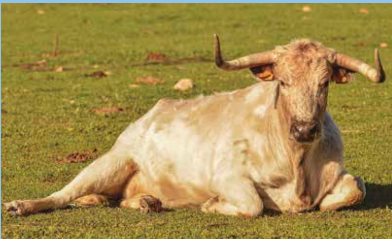
Una preciosa vaca vazqueña sestenado tranquilamente