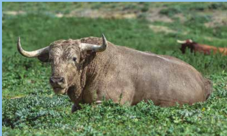
Un vazqueño de Julio de la Puerta rumiando y descansando