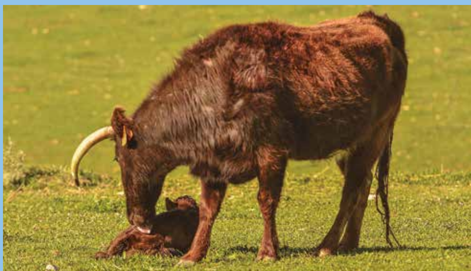
Una dama de La Valdivia acicalando a su recental de muy pocos días de vida

El joven sueña con ser torero y se prepara concienzudamente para ello. Valor no le falta, como demostró durante el tentadero al reponerse de una importante voltereta y volver a la cara de la becerrra como si nada hubiera sucedido. Tampoco le faltan maneras. De momento es novillero sin picadores y ya ha toreado en plazas de la importancia de Ronda o Huelva. Esperemos que el tiempo le permita hacerse un hueco en el escalafón.