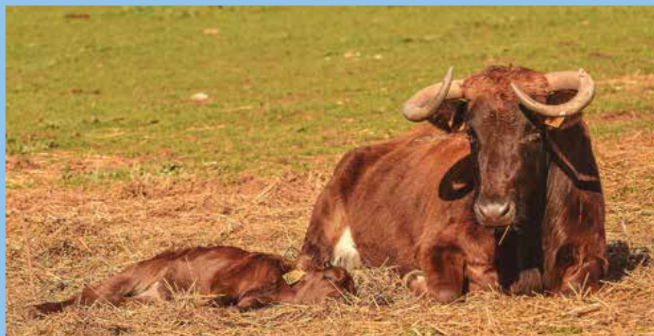
Becero descansando bajo el cuidado de la madre pendiente de los movimientos