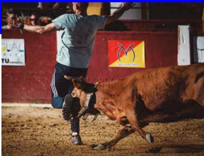
La de Eulogio Mateo puso en serios apuros a Jarque