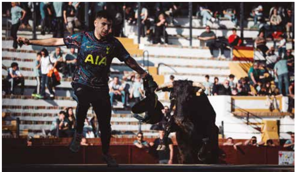
La vaca Colilla de La Paloma dejó una gran subida a la pirámide tras Pepito

Siendo más joven, Colilla pecaba a veces de desenfocarse rápido, pero ahora ya "se ha hecho vaca". Transmite tanto por abajo como por arriba. Subió y bajó a la pirámide con intención de matar, remató en el cono, en el tablado y en todos los obstáculos con muchísimo sentido y peligro. El momento culminante llegó con el último remate en tablas a Ander, donde se tiró literalmente a por él. Corazón, entrega, prontitud y bravura resumieron una actuación memorable. La vaca abandonó la plaza entre una fortísima ovación.