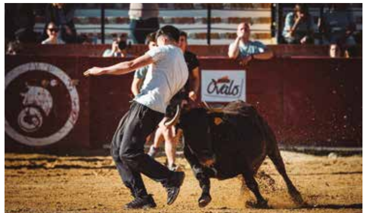
Ajustado quiebro de un joven a Faraona de Fernando