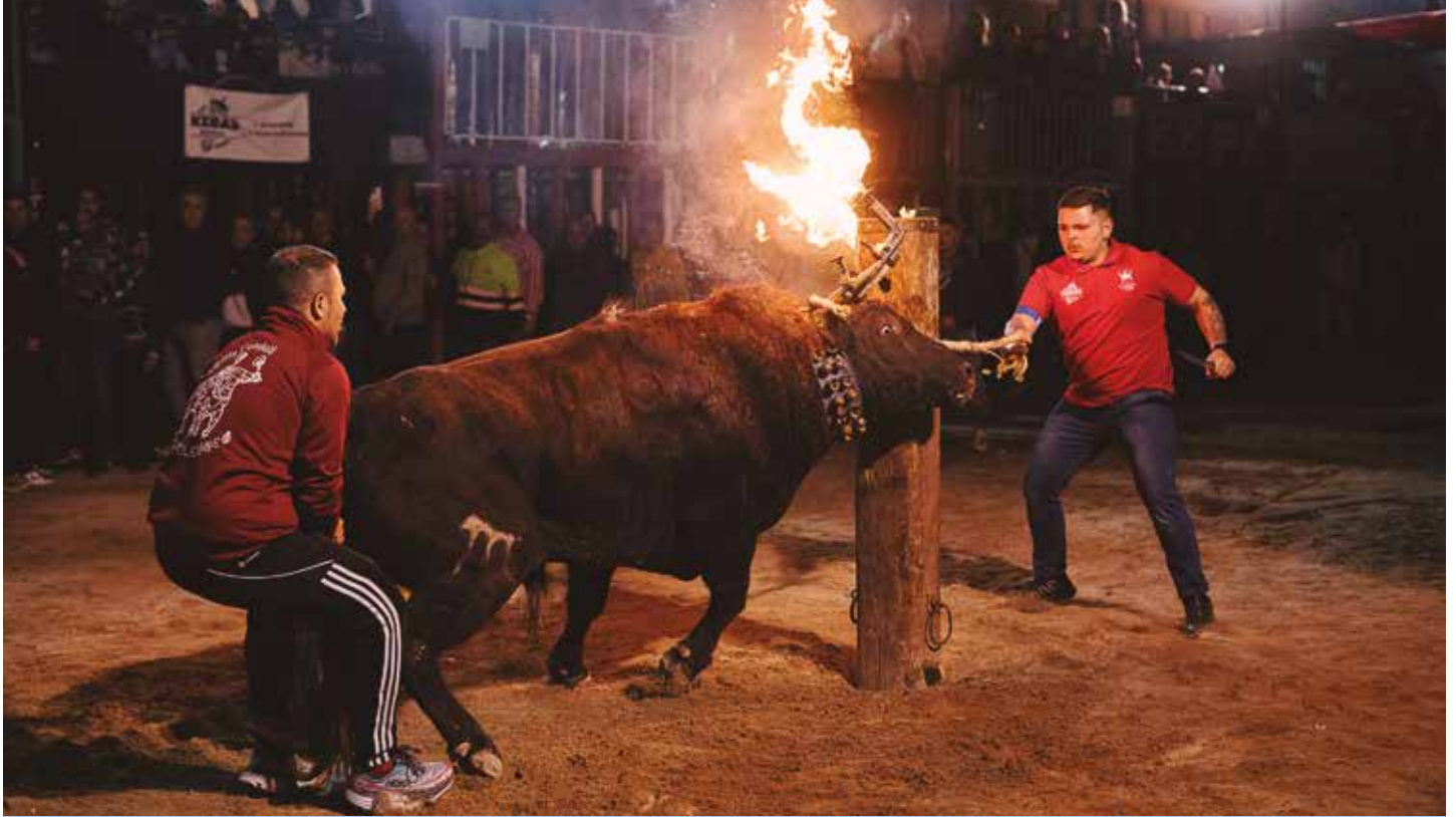
El buen Picantón número 86 de El Pilar tuvo un buen comportamiento por la tarde y 10 minutos muy buenos tras la cortada de cuerda

La apuesta conjunta de la comisión y un comercio local permitió completar una intensa semana taurina marcada por los toros de El Pilar y la destacada actuación final de Pachín, de Valrubio.