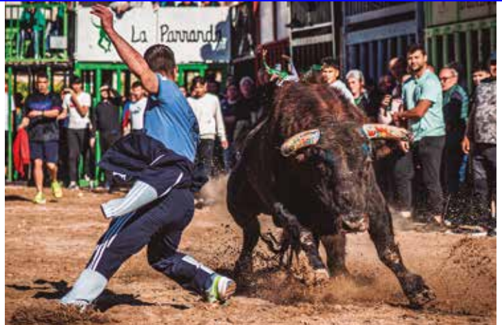
Buenos momentos tuvo Picantón en la arena por la tarde

El miércoles 15, por la noche y después de todo un día de fiestas, La Morada realizó una divertida y entretenida noche taurina con un corro de novillas enfundadas. Se vieron los típicos revolcones junto a recortes de gente menos valiente en otras circunstancias.