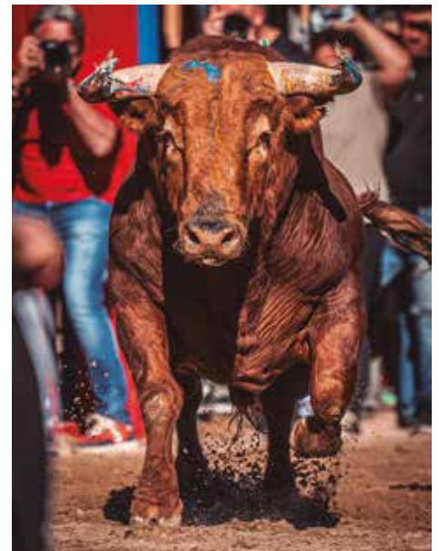
Bonito este Bello nº 54 de El Pilar

En definitiva, felicitar a los festeros por la gran semana conseguida, dejando personalmente un muy buen sabor de boca y demostrando que no por hacer más se hace mejor.