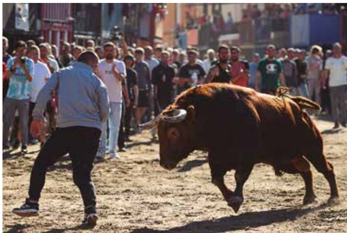
El armónico Bello nº 54 de El Pilar tuvo una correcta salida