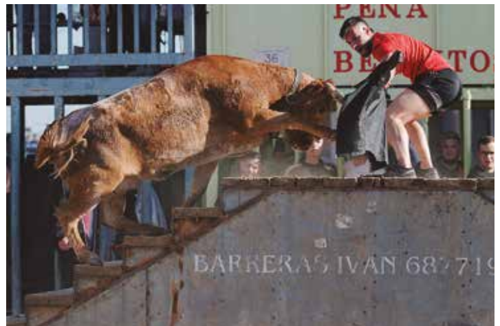
Buena tarde realizó La Morada en la tarde del viernes