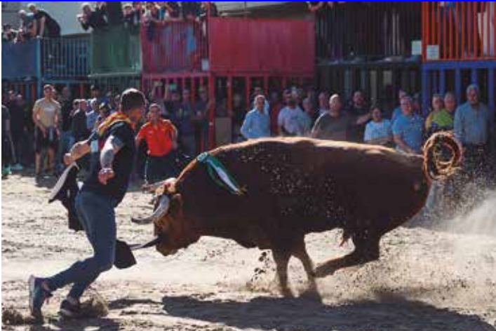
Parando al 54 de El Pilar que terminó mermado por una caída